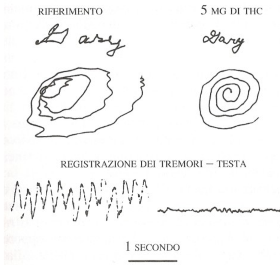
Figura 2. Registrazione elettromagnetica del tremore da contrazione muscolare che interessa le dita e la mano in un esercizio di indicazione condotto alla mattina, prima di aver fumato una sigaretta di marijuana, e alla sera, dopo averla fumata.

Riprodotta da H.M. Meinck, P.W. Schijnle e B. Conrad, "Effect of Cannabinoids on Spasticity and Ataxia in Multiple Sclerosis", Journal of Neurology 236 (1989): 120-122